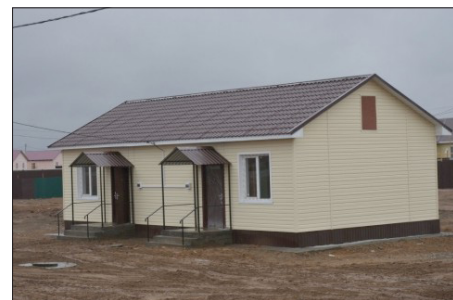
Использована информация официальных порталов

Администрация муниципалитета могла подрядчикам провести в дома газ и воду. К сожалению, суммы контрактов не хватило для приведения в порядок прилегающей к домам территории: прокладки тротуаров, посадки деревьев и цветов, проведения уличного освещения. Эту часть работы муниципалитет пообещал председателю правительства взять на себя. Ещё до начала лета микрорайон Радужный села Маячное наполнится новыми жителями.