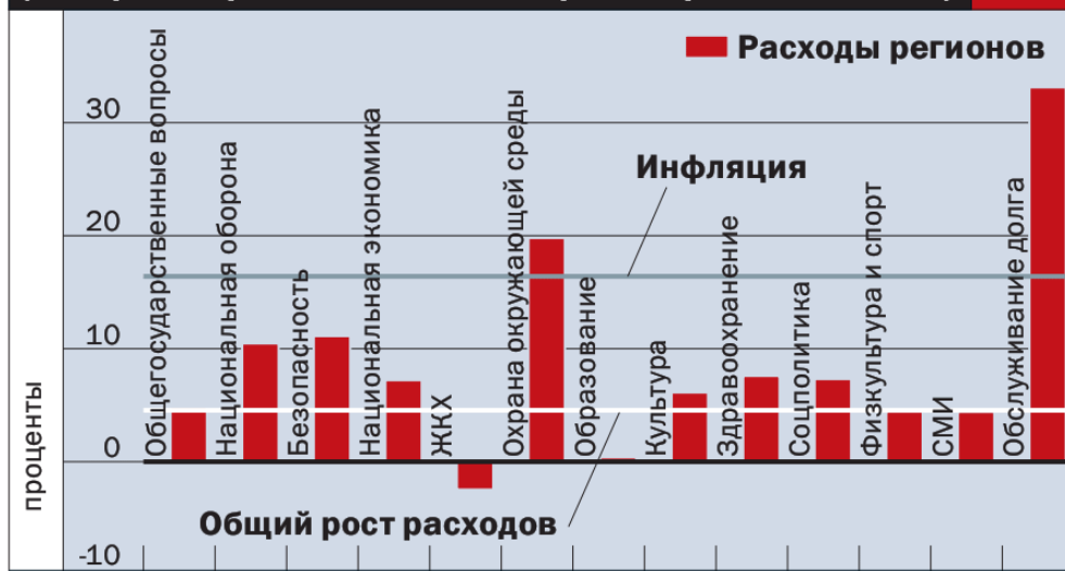
График 1. Как изменились расходы регионов (январь—апрель 2015-го к январю—апрелю 2014 года)