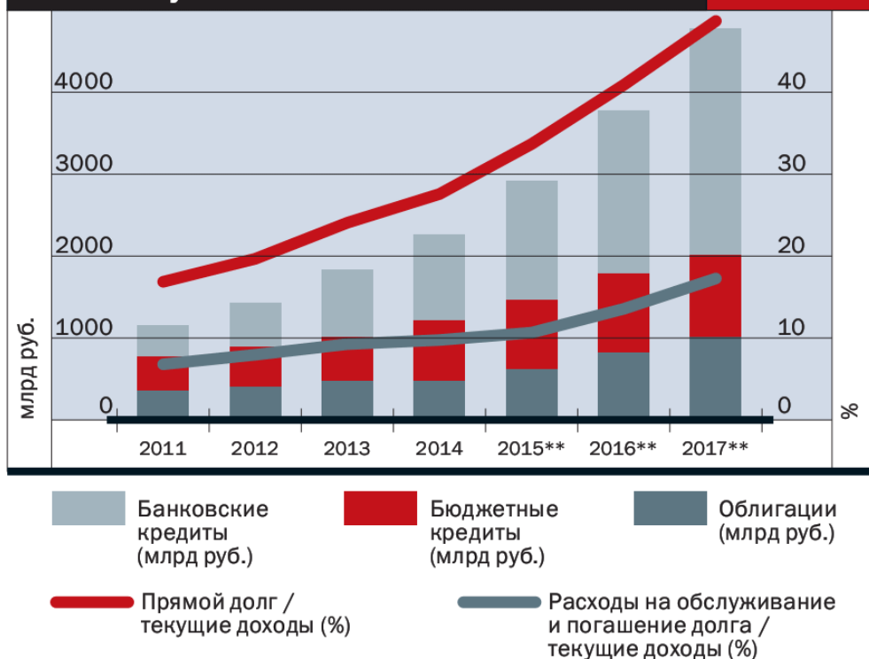
График 2. Объем долга российских региональных и муниципальных органов власти и расходы на его обслуживание и погашение*

*Расходы на обслуживание и погашение долга не включают банковские кредиты, привлеченные в рамках возобновляемых кредитных линий. Сертификаты участия в займе объемом 374 млн евро сроком погашения в 2011 году и 407 млн евро сроком погашения в 2016 году, выпущенные городом Москва, были переклассифицированы как облигации (а не кредиты).